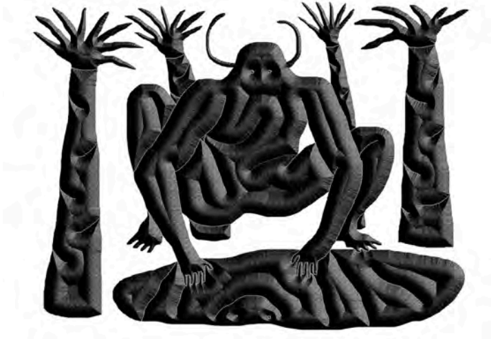
Célestin Krier, Back to the cave, 2016