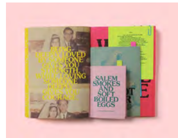
Imposition multi-format possible